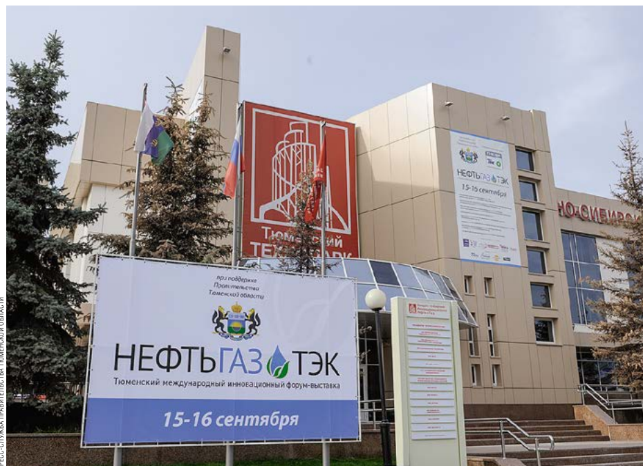
ПРЕСС-СЛУЖБА ПРАВИТЕЛЬСТВА ТЮМЕНСКОЙ ОБЛАСТИ