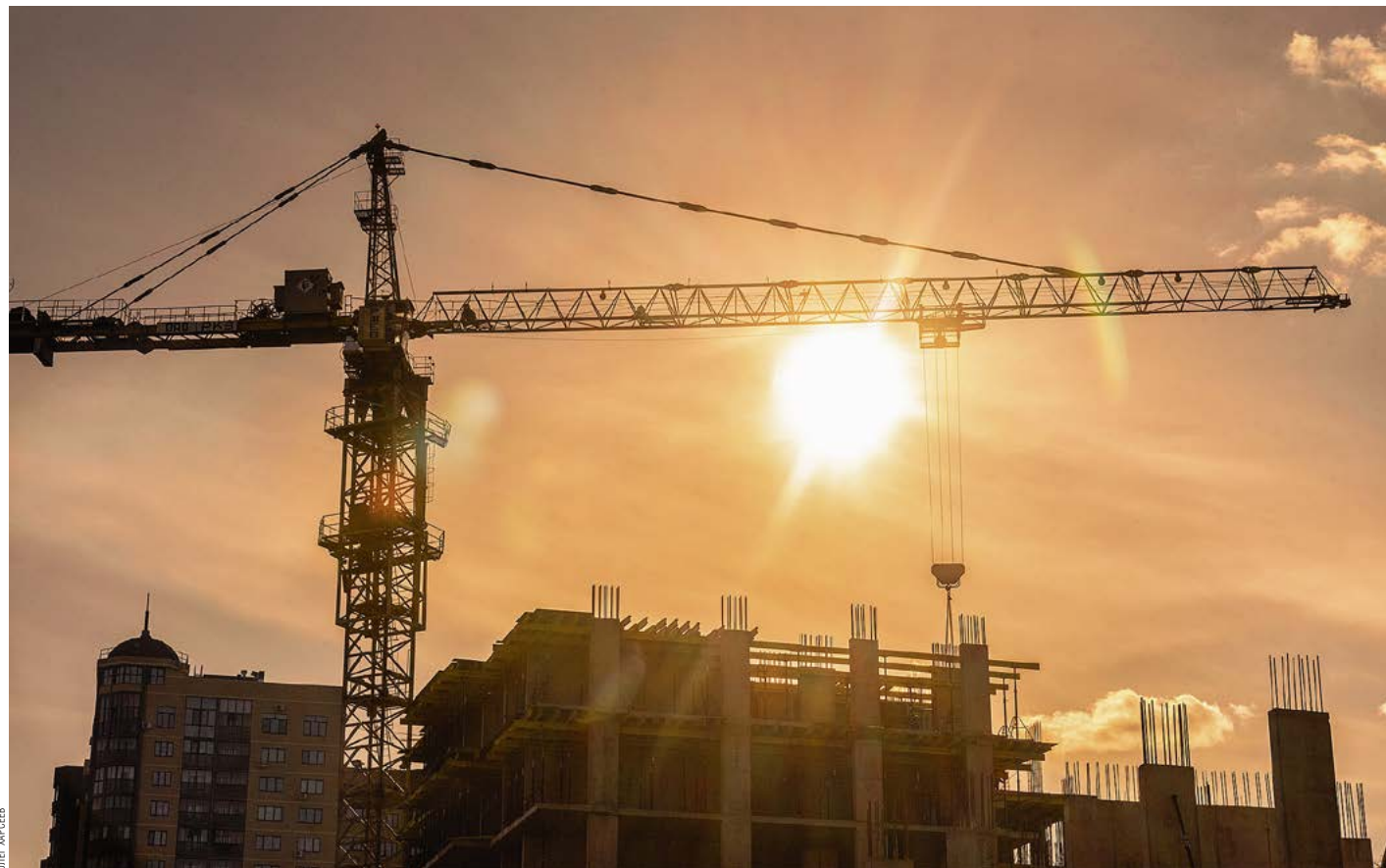
В ЭТОМ ГОДУ РЕГИОН НАМЕРЕН ВВЕСТИ БОЛЕЕ 1,5 МЛН КВ. М ЖИЛЬЯ

Стоимость 1 кв.м жилья, утвержденная для программы «Сотрудничество», составила 48,2 тыс. руб.