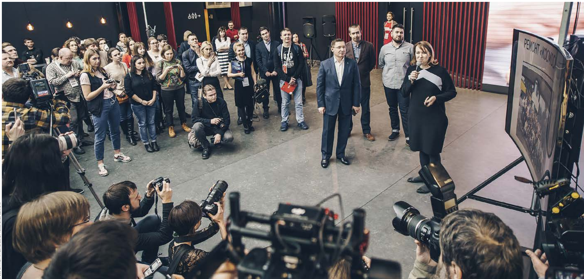
ПРЕСС-СЛУЖБА ПРАВИТЕЛЬСТВА ТЮМЕНСКОЙ ОБЛАСТИ