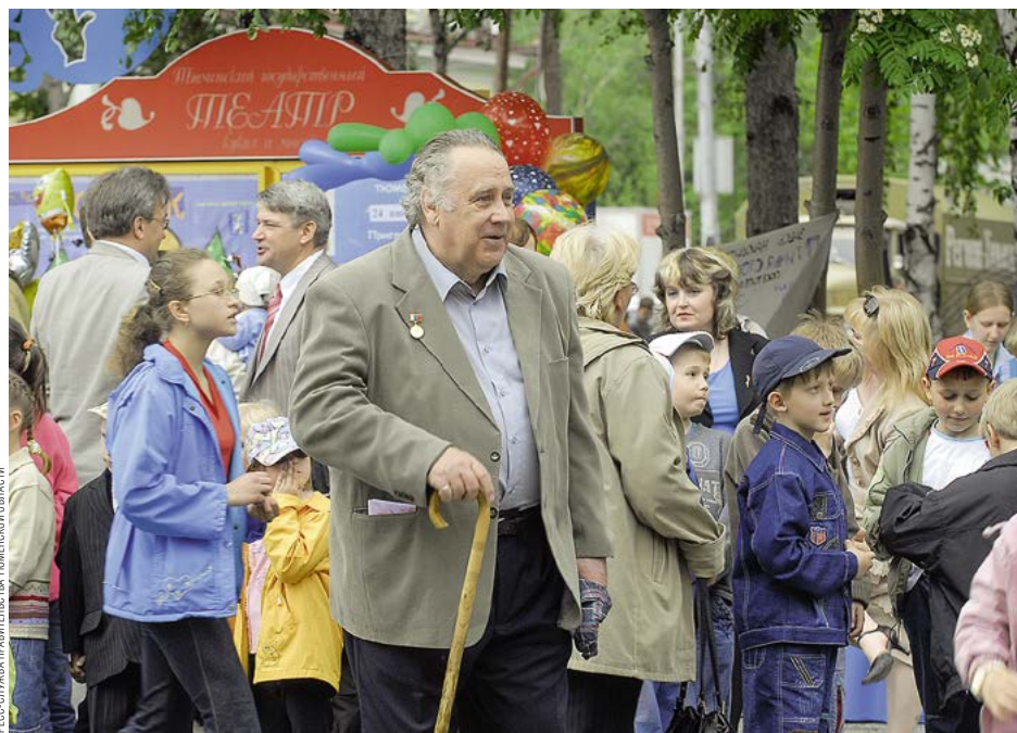
ПРЕСС-СЛУЖБА ПРАВИТЕЛЬСТВА ТЮМЕНСКОЙ ОБЛАСТИ