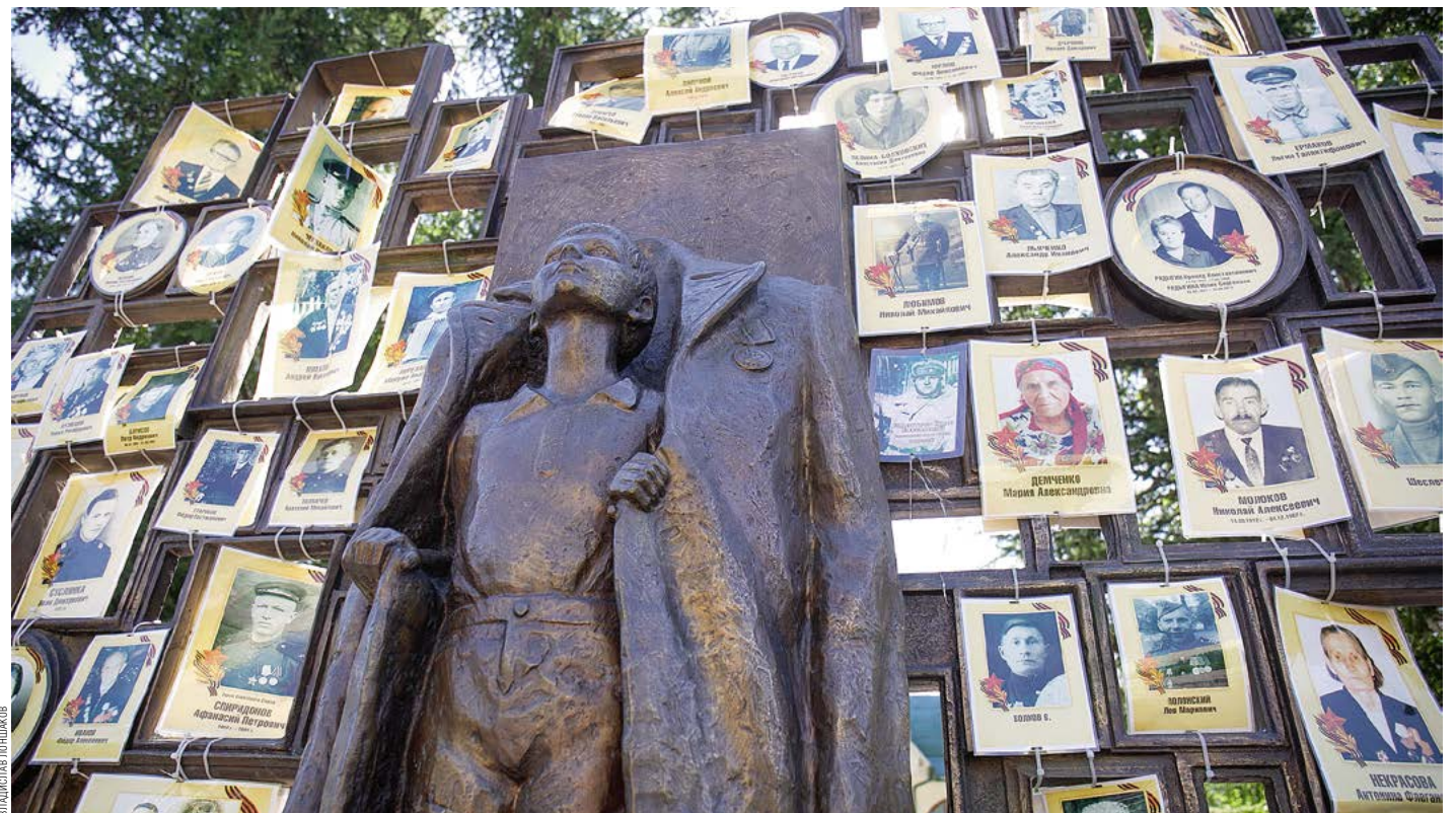
ПАМЯТНИК «С ЧЕГО НАЧИНАЕТСЯ РОДИНА» В СКВЕРЕ ИМЕНИ М.И. ГУБКИНА

ЗОЛОТУЮ МАСКУ ПРИМЕРИЛИ ТЮМЕНИ 2019 год в России объявлен Годом Театра. В рамках этого, Тюменская область приняла участие во Всероссийском театральном марафоне, а в июле областная столица стала площадкой для Международного фестиваля уличных театров «Сны