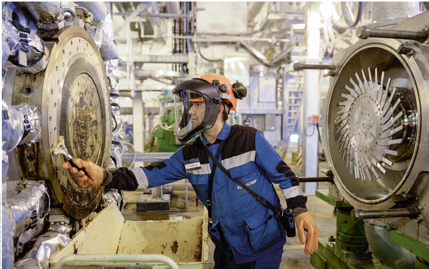
КОМПАНИЯ СИБУР СОЗДАЕТ В ТОБОЛЬСКЕ КРУПНЕЙШИЙ НЕФТЕХИМИЧЕСКИЙ КОМПЛЕКС РОССИИ «ЗАПСИБНЕФТЕХИМ»

Цифровые проекты запускает и АО «ЭР-Телеком Холдинг». Компания подготовит в регионе сеть базовых станций стандарта LoRaWAN, на основе которых будет функционировать промышленный интернет вещей (IIoT). Технологию планируется использовать в разных smart-сервисах региона. «Безусловно, один из важнейших для нас проектов — это развитие аппаратно-программного комплекса «Безопасный город». Думаю, внедрение «умных домофонов», с помощью которых можно собирать большие объемы информации, будет очень полезным шагом на пути обеспечения безопасности тюменцев», — рассказал губернатор Александр Моор. Smart-технологии способствуют снижению уличной преступности и повышают эффективность коммунальных служб. Возможно, IIoT будут использовать на инженерных сетях и автодорогах Тюменской области.