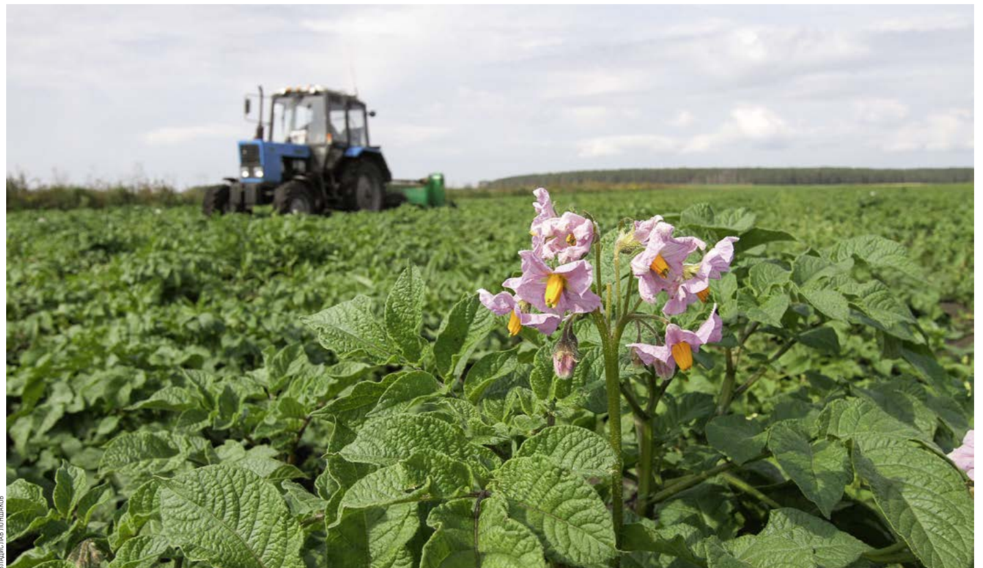
К 2024 ГОДУ РЕГИОН ПЛАНИРУЕТ НАРАСТИТЬ ОБЪЕМ ЭКСПОРТА ПРОДУКЦИИ АПК ДО $28,4 МЛН

«Центр оснащен комплексом сбора, обработки и хранения данных о параметрах режима работы оборудования энергосистем Уватского проекта, отображение которых происходит в реальном времени на видеостене. Высокая степень автоматизации позволя-