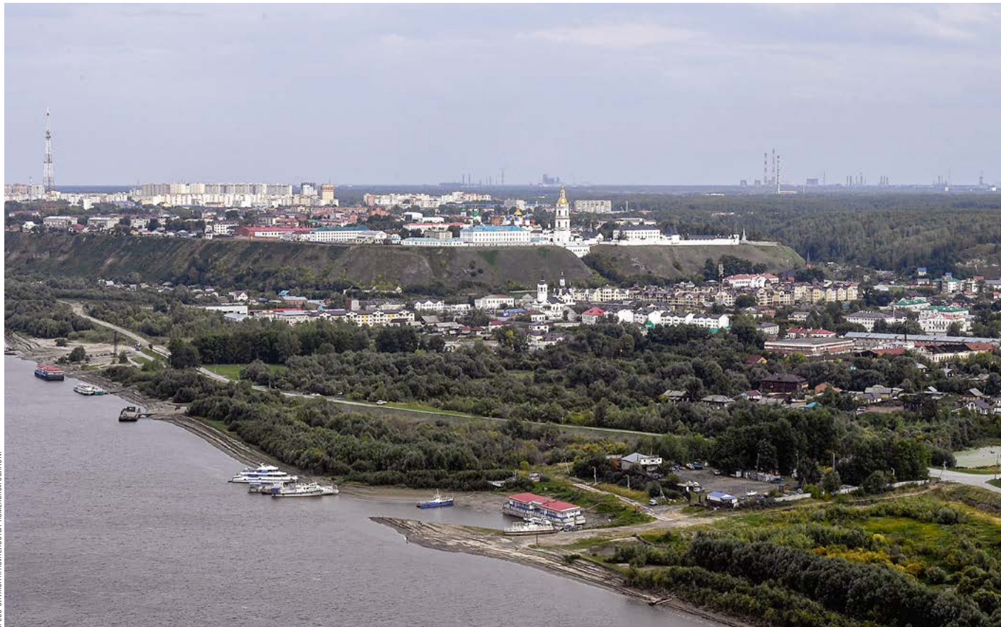
ПРЕСС-СЛУЖБА ПРАВИТЕЛЬСТВА ТЮМЕНСКОЙ ОБЛАСТИ

Со временем освоение месторождений Западной Сибири получило статус Всесоюзной ударной комсомольской стройки. Свою роль в этом сыграл Геннадий Шмаль, будучи первым заместителем министра строительства предприятий нефтяной и газовой промышленности СССР (в 1984–1990 годах). Благодаря этому в регион потянулись сотни жителей Советского Союза.