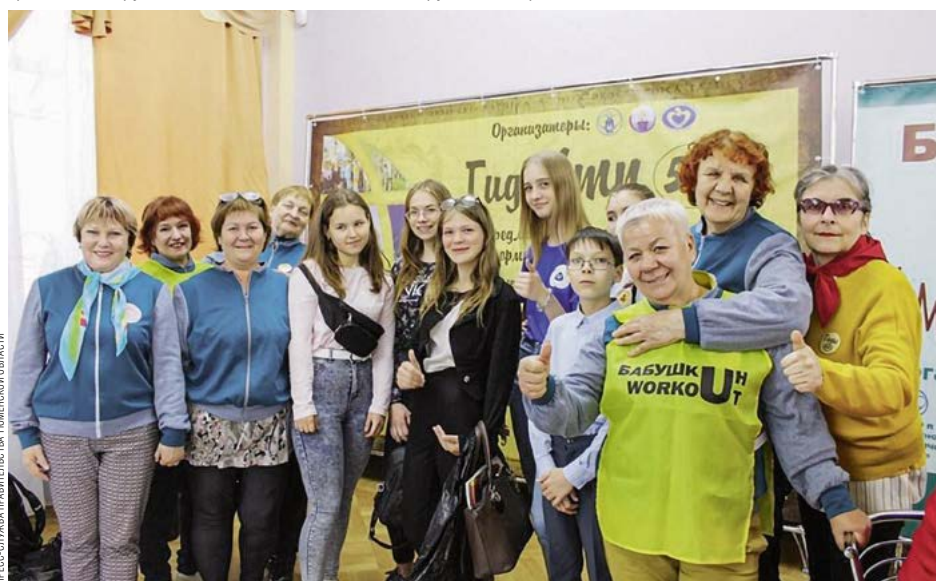
РЕГИОН ПОДДЕРЖИВАЕТ СЕРЕБРЯННОЕ ДОБРОВОЛЬЧЕСТВО

В последние три года в регионе растет интерес к социальному предпринимательству. Так, в Тюмени был запущен образовательный проект «Школа социального предпринимательства». Он был разработан для субъектов малого и среднего предпринимательства, представителей социально ориентированных некоммерческих организаций, физических лиц, планирующих предпринимательскую деятельность