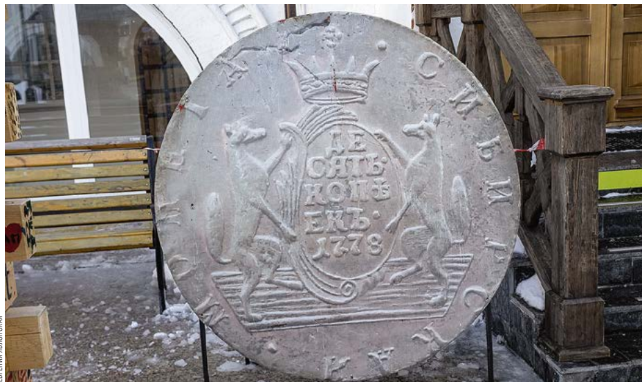
АРТ-ОБЪЕКТ «КРЕМЛЕВСКИЙ СТРАЖ»

Юрий Шафраник был первым главой Тюменской области в постсоветский период, с 1991 по 1993 годы. Его заслуги по развитию промышленности региона оценили в Кремле, назначив министром топлива